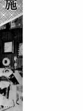
調査員が事業所を訪ねて調査票を記入している様子

調査の内容は、事業の種類、経営の規模、従業者数に関する事項などです。そして申告されたことからは、統計を作るために用いられ、徴税などの資料に使われることは絶対ありませんし、調査関係者が他に漏らすことは決してありません。