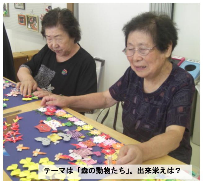
テーマは「森の動物たち」。出来栄えは?