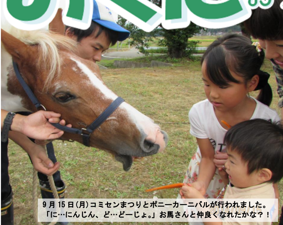
9月15日(月)コミセンまつりとポニーカーニバルが行われました。 「に…にんじん、ど…どーじょ。」お馬さんと仲良くなれたかな?!