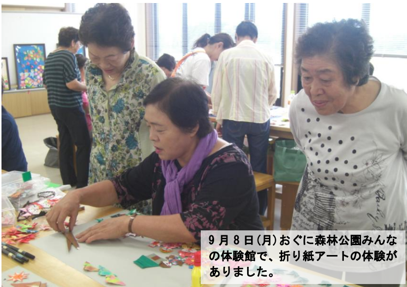
9月8日(月)おぐに森林公園みんなの 体験館で、折り紙アートの体験が ありました。