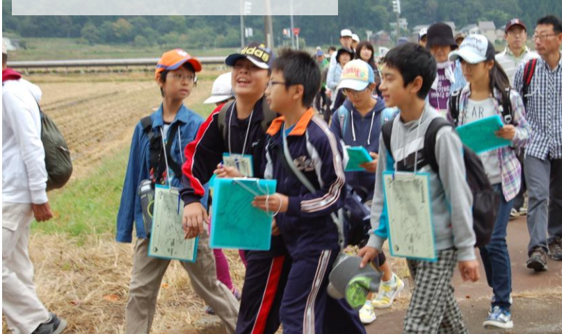
10月5日(日)おぐにウォーキング大会