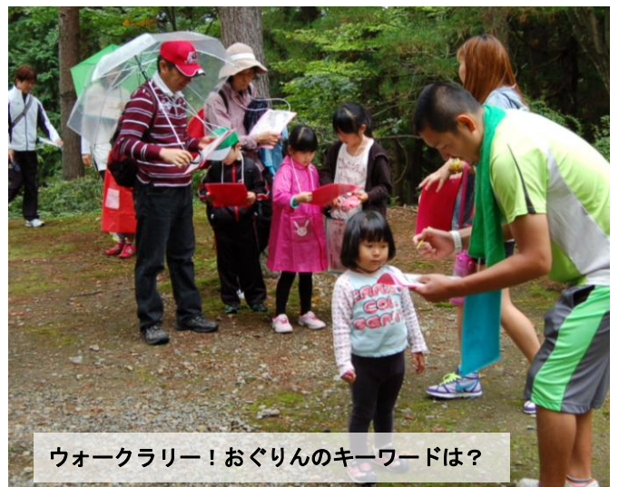
ウォークラリー! おぐりんのキーワードは?