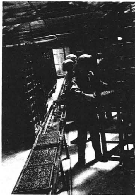
▶ 緑化室に3日間。その後、硬化ハウスで2週間。