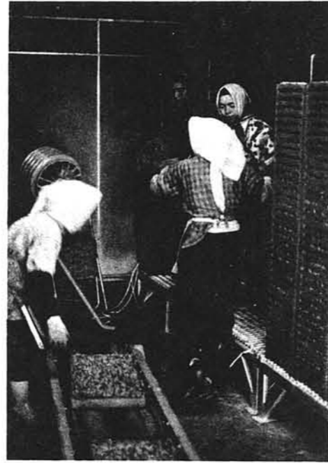
▶ 出芽室に3日間入れる。