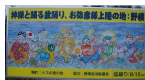
▲「長岡市地域コミュニティ事業補助金」を活用してPR看板を作成

同地区では、伝統文化の継承と地域の活性化や連帯感の向上を目指して、巡回型の盆踊りを実施しています。