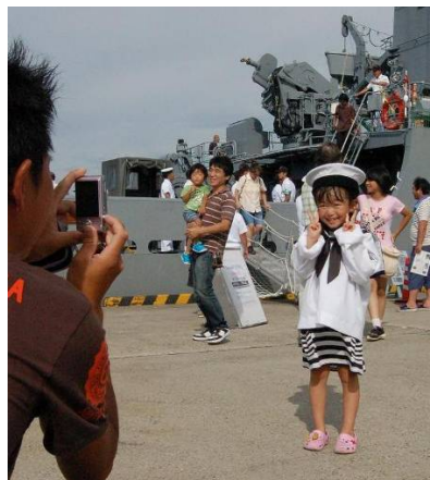
▲自衛隊のコスチュームで「ひうち」をバックにパチリ！