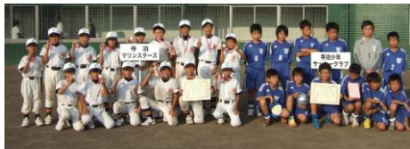
◀「寺泊マリンスターズ」(左)と「寺泊少年サッカークラブ」

8月25日、寺泊地域の少年サッカーチームと野球チームが伊勢崎市を訪れ、9月1日には伊勢崎市のジュニアバレーボールチームを寺泊に迎えて、親善試合を開催しました。