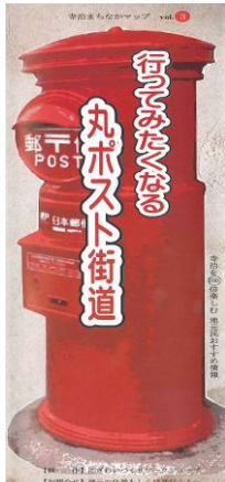
▲パンフレットを片手にあなたも歩いてみませんか。