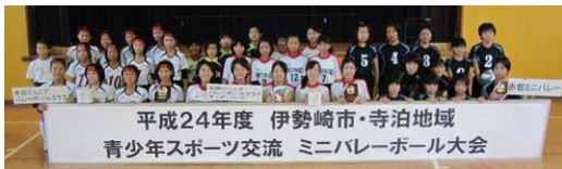
▲「寺泊ジュニアバレーボールクラブ」(左)と伊勢崎市のチーム