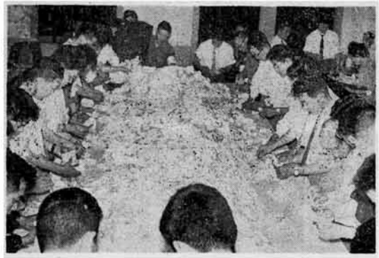
〈前回の市長・市議補欠選挙の開票風景〉