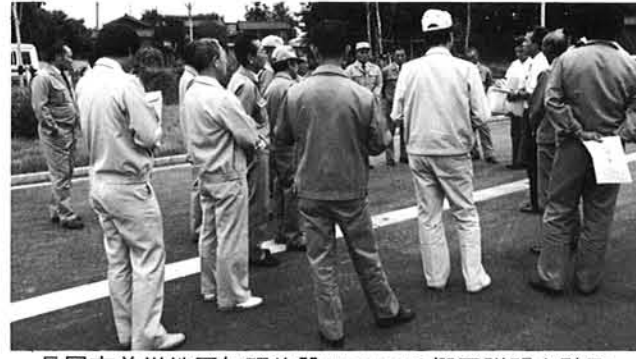
長岡市前川地区処理施設について概要説明を聴取

公共下水道事業 22112 先進地視察 tour 本村においても公共下水道及び集落排水事業を実施することに伴い、全議員で下水道の運営状況並びに処理方式等について先進地である長岡市前川地区処理施設、小千谷市鴻野谷地区処理施設、小千谷市鴻野谷地区処理施設について概要説明を現地において聴取し視察しました。