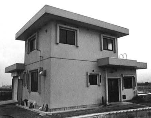
小千谷市鴻野谷地区処理場

公共下水道事業 22112 先進地視察 tour 本村においても公共下水道及び集落排水事業を実施することに伴い、全議員で下水道の運営状況並びに処理方式等について先進地である長岡市前川地区処理施設、小千谷市鴻野谷地区処理施設、小千谷市鴻野谷地区処理施設について概要説明を現地において聴取し視察しました。