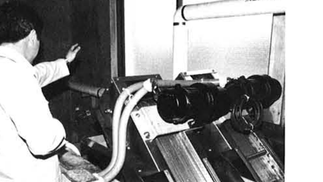
小千谷市鴻野谷地区処理施設