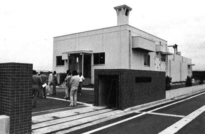
長岡市前川地区処理場

県道の歩道については、年々整備が進められているが、反面歩道除雪ということになると、県及び村もその対応には積極的な姿勢が全く見受けられない現状である。 歩道の重要な役割、歩行者の事故防止等を考えるとき、仮に県の対応が駄目ならせめて村が除雪機械を導入した中で地元へ委託をされ除雪を願いたいものであるが、村長はどう考えているか。 ◎ 村長答弁概要 事情については十分承知しているが、国の管理あるいは県の管理、末端の地方自治体の管理というように、それぞれの行政上のルールというものがあるのでそうはいかないということ一つ理解いただきたい。 歩道除雪については今後も県に対し積極的に要請して行きたいと思っているので現状については理解をいただきたい。