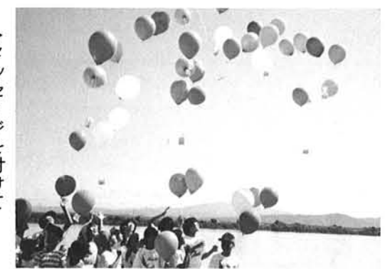
▶メッセージを付けて風船を飛ばす

だちのところへ届いてと願いをこめて青空へ飛ばしました。現在二通のお便が届いております。