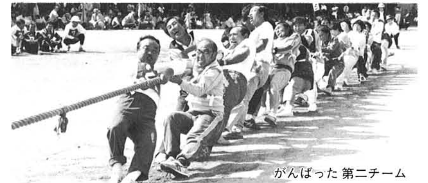
がんばった 第二チーム