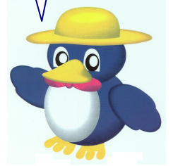
▲市の環境キャラクター ペギーちゃん