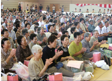
▲お祝いのアトラクションに、会場は笑顔と拍手につつまれました。