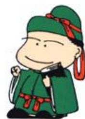
和島地域生涯学習キャラクター なら主わし麻呂くん