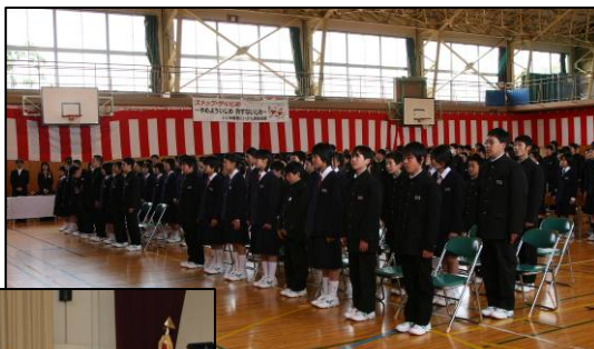
▲1年A組24名、1年B組23名、計47名の生徒が入学。