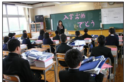
◆教室では、新しい教科書の多さに戸惑う生徒も…。