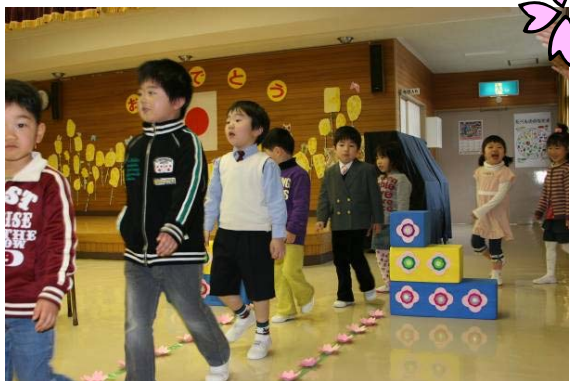
▲園児46名が元気に入場です。みんな元気に「ハイ!」と返事をしました。