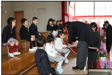
▲校長先生から新1年生15名に、新しい教科書が手渡されました。