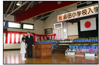
▲児童一人ひとりが校長先生と握手をかわしました。