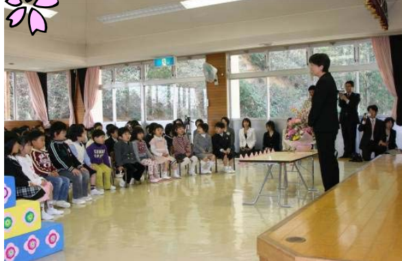
▲「山や木がみんなを待っていました」と園長先生。たくさん思い出つろうね!!