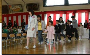
←上級生に手をひかれ、わくわくドキドキの入場です。