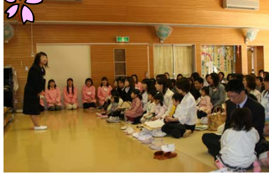
▲園長先生から「いかのおすし」を教わりました。みんな守れるかな。