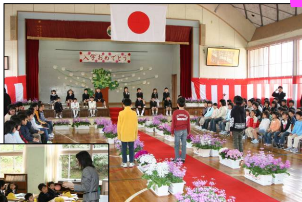
▲4年生の児童から「わからないことがあったら何でも聞いてください」とお祝いの言葉をもらいました。