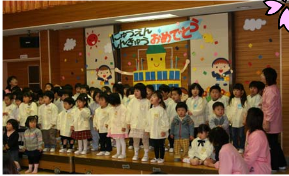
▲みんなで元気に「チューリップの歌」や「歩こう」を歌いました。