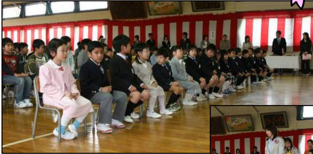
▲新1年生17名、島田小学校最後の1年生です。