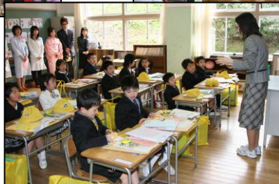
▲式を終えて教室へ。ピカピカの帽子やカバンにドキドキ。