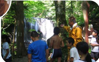
▲リトルアドベンチャー(達沢不動滝)