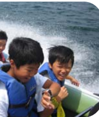
▲モーターボート体験(桧原湖)▲