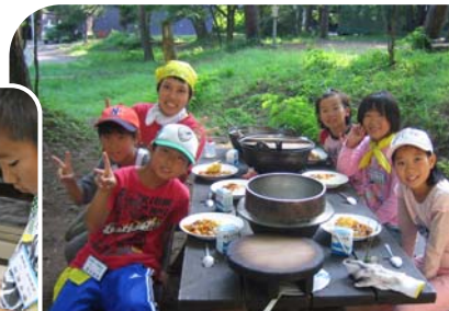
▲野外炊飯(カレーライス作り)