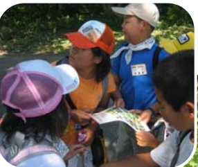
▲森のスタンプラリー