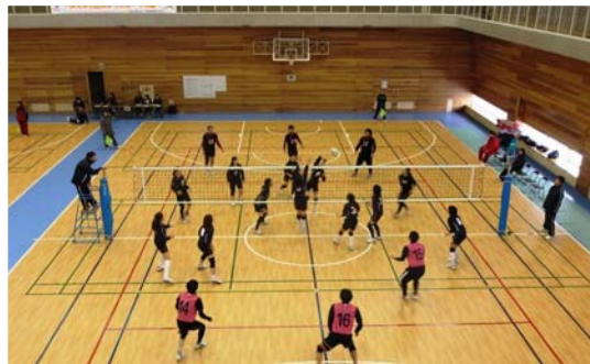
▲激闘を繰り広げる『和島チーム』(写真奥側)

2月17日(日)、市内各地で行われた地域交流スポーツ大会。この日、中之島体育館では、「男女混合バレーAブロック」が行われ、和島チームが出場しました。 結果は惜しくも予選リーグ敗退でしたが、強豪ぞろいの中、貴重な1勝をおさめました。お疲れ様でした。