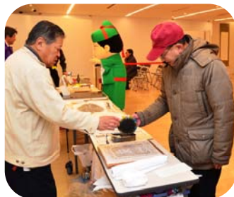
▲会場では拓本にも挑戦!