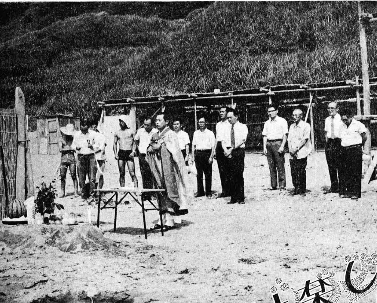
落水海水浴場海開き