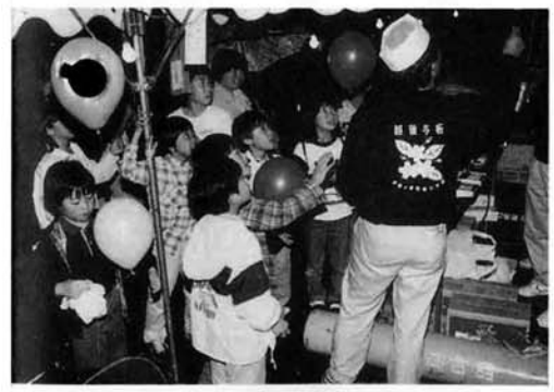
▲ 堂前中島町青壮年部の風船には人気も集中