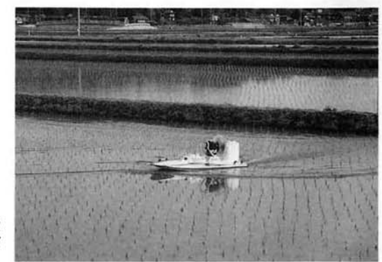
リモコンボートを使っての農薬散布

最近では「農業経営法人」の設立を進める地域も増えていきます。会社として農業を行うことで、いわば、労働力を共有しています。単に作物を生産するだけでなく、生産物を加工製品に変えて販売に結びつけている例