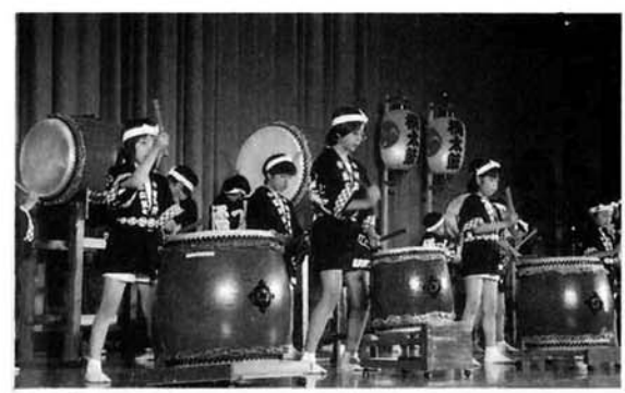
▲ 会員も増えてますます充実 ～城山鼓友会ジュニアチーム～