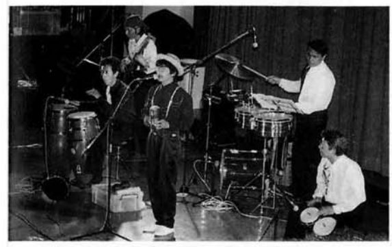
▲ ラテンのリズムにノリました ～ラテンマニアオーケストラ～