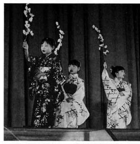
▲ しぐさがかわいい伊達舞踊研究会

が、5月24日に行われました。河川公園まつりから名称を変えて、更にボリュームアップした催しも、開始直前に降り出した雨で、残念ながら急ぎょ町民体育館に会場が変更されました。今回初出演の中学校吹奏楽部やたちな太鼓などによる第1部の演奏会に続き、第2部では新舞踊や大マジックショー、爆笑のワンマンオーケストラや感動の民謡ショーと多彩な出演者による素晴らしいステージを、集まった約千人の方が心ゆくまで堪能しました。