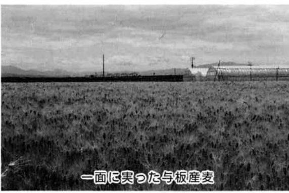
一面に実った与板産麦

春の田植えには始まり、秋の収穫まで、私たちの心にかかるお話を与えてくれた田んぼが、こがね色から土色にその姿を変え、鮮やかに映える緑がほつんと。まるでそこにだけ、じゅうたんを敷き詰めたような、ことうした光景に目を奪われた経験をお持ちの方も多いのではないのでしょうか。そう、そこには麦が育っています。稲刈りが終わり、新米の便りが食卓に届く頃に播かれた麦は、3カ月もの間、雪に身を踏まれながらけなげに春を待ちます。雪が解け、暖かい陽射しを浴びて一気に成長す