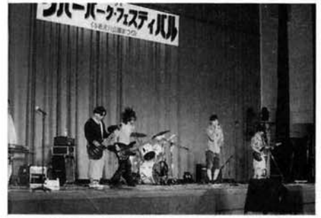
▲ 体育館も揺れた？ ～与板高校ロックバンド演奏～