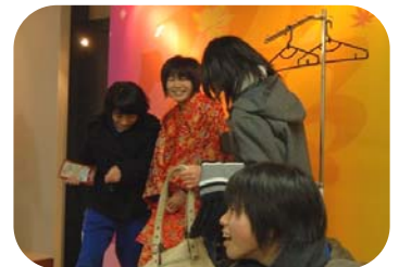
▲ お船の方コーナーでは着物をはおりお船に変身!