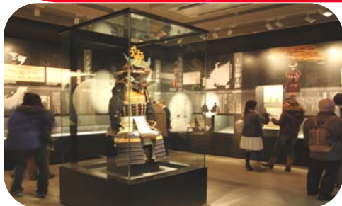
▲ 愛の甲冑(複製品)がどの角度から見れます。

天地人放映にあわせ与板歴史民俗資料館が愛称「兼続お船ミュージアム」としてリニューアルオープン! 当日は雪の降る中、約500人の来場者でにぎわいました。(1/10)