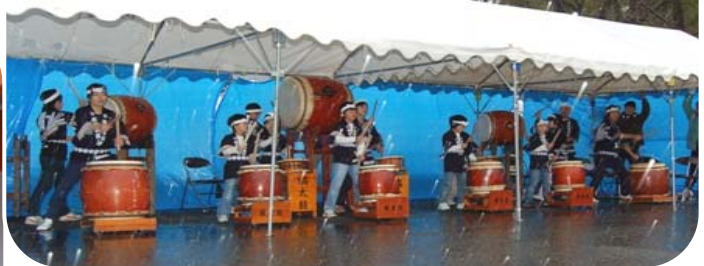
▲ 城山鼓友会も前ぶれ・エンディングでお祝い!