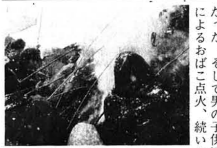
うまそうに焼けたスルメ……

去る一月十八日、本与板地域PTAが主体となって斉の神の行事を行われまし。老令者は再現を喜び、中年者はまだ見た事のない物にある種の心を引かれ、子供達は映写会の後で何かあるという程度しか理解していません。 本来ならば一月十五日に組み立てて焼くのが慣習だと言う事だけでも、五十年近く途絶えて居たこの風習の再現に、どの程度やれるものやら全く見当がつかなかった為、北魚沼郡広神村の教育委員会を訪れ、部落で実施されている様子について聴取した。やはり同