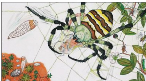
『だんごむしそらをとぶ』小学館