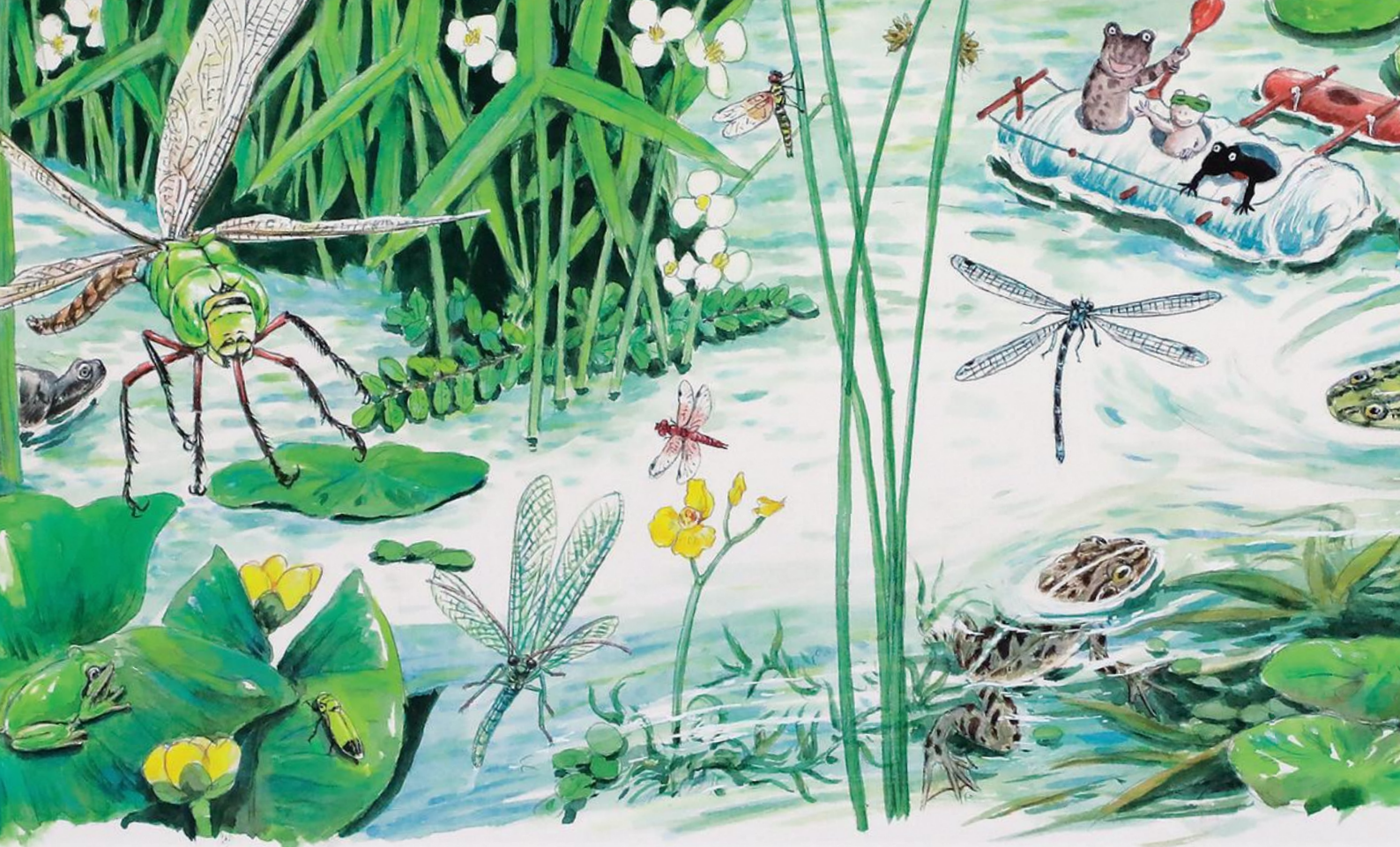
「イモリくんやモリくん」(部分) 岩崎書店