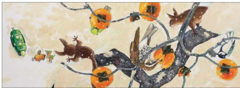
『あまがえるりょうこうしゃ ゆきやまたんけん』福音館書店

今年、画業56年を迎えた松岡さん。その多彩な画業を振り返るとともに、自然を愛し自然に育まれてきた松岡さんの、豊かな作品世界を紹介します。