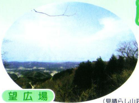
望広場 (見晴らし山荘) 標高300m程度の陵線を中心としたゾーンである。日本海側まで見渡せる絶景ポイントです。