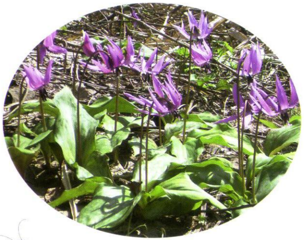
かたくりの花 4月初旬が見頃です