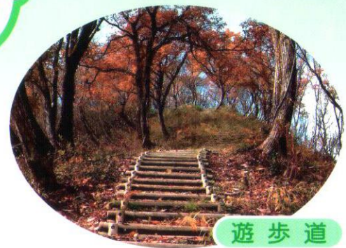
遊歩道 緑に囲まれた遊歩道を通して四季折々の景観が楽しめます。多くの種類の野鳥を見ることができます。