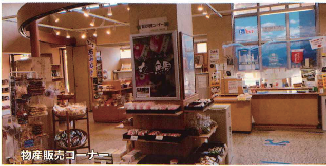
物産販売コーナー