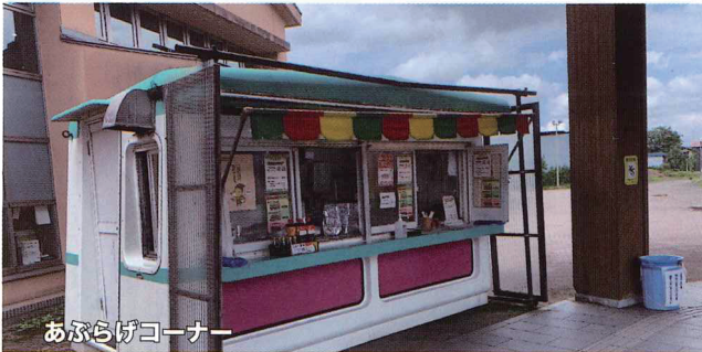
あぶらげコーナー