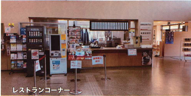
レストランコーナー