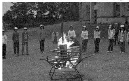
夏のつどい in 妙高