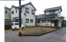
新潟県燕市(土地) 譲渡額約350万円