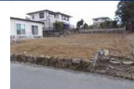
三重県津市(土地) 譲渡額約270万円