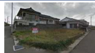
鹿児島県いちき串木野市(土地) 譲渡額約350万円