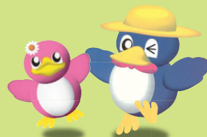
長岡の環境キャラクター ベギーちゃん