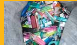
ライター(有害危険物です)