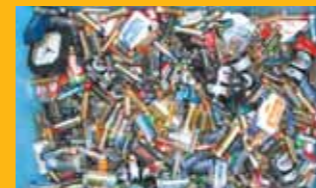
電池(有害危険物です)