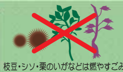
枝豆・シソ・栗のいがなどは燃やすごみ

家庭菜園で出た野菜の葉や茎、つるなどは、たい肥化容器などでできるだけ自然に還してください。ごみで出す場合は燃やすごみになります。