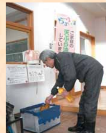
大積コミュニティセンターで

使用済み天ぷら油はバイオディーゼル燃料や石けんの原料として活用されています。ごみに出さずにリサイクルに回すよう、ごみの減量と資源のリサイクルにご協力をお願いします。