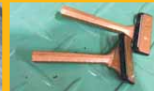
カミソリ(燃やさないごみです)

左写真の電池とライターは、1ヶ月間で出たものです。このほかにも、生ごみや紙類、刃物など「燃やすごみ」「燃やさないごみ」として出すべきものがまだまだ混ざっています。