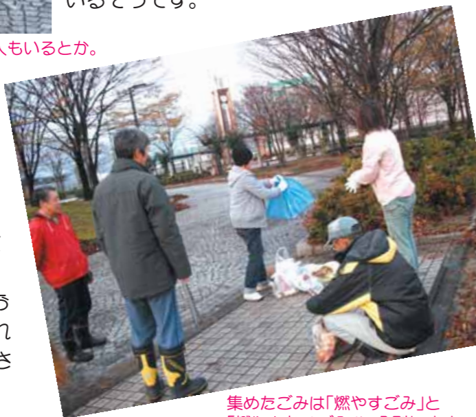
集めたごみは「燃やすごみ」と「燃やさないごみ」に分別します。

「みんなの憩いの場だから、お互いに気持ちよく使いたい。それに尽きますね。」掃除を終えた皆さんは、すがすがしい笑顔でした。