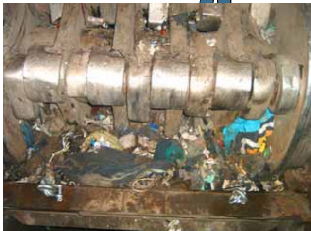
ブルーシートなどが回転破砕機にからまった状態