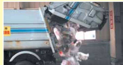
①ごみ収集車が施設へ到着し、プラスチック容器包装材が空けられます。

週に1回収集しているプラスチック容器包装材は、ごみステーションを離れた後、西陵町にある「環境資源開発」で選別、圧縮、梱包されてリサイクル事業者へ引き渡されます。その流れをご紹介します。