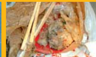
弁当の食べ残し(燃やすごみです)