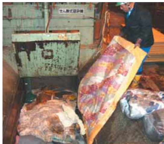
粗大ごみはあらかじめ裁断しています