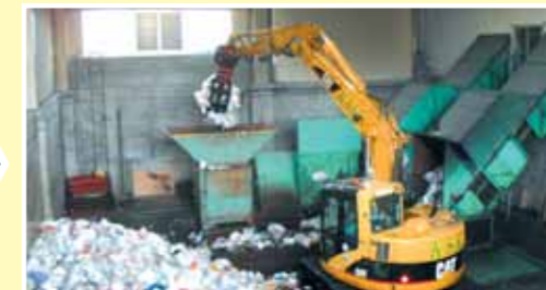
②袋を破る機械に投入します。

圧縮梱包されたプラスチック容器包装材は、リサイクル事業者へ引き渡され、プラスチック製品(ガーデニングの擬木、杭など)の原料となったり、燃料油になったりしています。