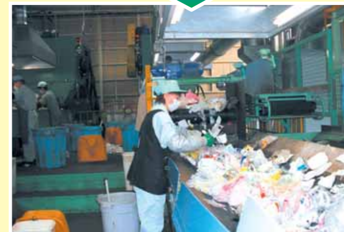
③混入した異物は、手作業で取り除かなければなりません。

汚れが落ちていなかったり、プラスチック容器包装材でないものが混ざっていたりするとリサイクル事業者に引き取ってもらえないこともあります。分別収集にご協力をお願いします。