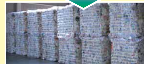
④1m四方の立方体に圧縮梱包されます。一日40梱包、量にして12~13トンできあがりです。