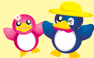
長岡の環境キャラクターペギーちゃん