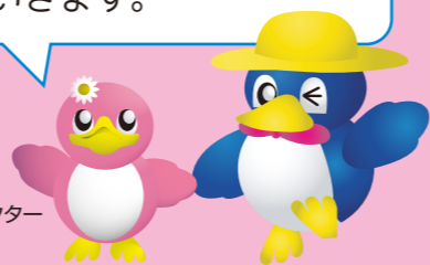
長岡の環境キャラクター ベギーちゃん

この情報誌は、長岡市のごみの現状や、ごみの減量とリサイクルを進めるための取り組みを紹介していきます。