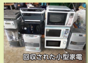
回収された小型家電

詳しい品目は、「長岡市ごみと資源物の分け方と出し方」冊子をご覧ください。市ホームページからは、 資源物の拠点回収 で検索。