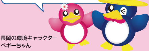
長岡の環境キャラクター ペギーちゃん

この情報誌では、長岡市のごみの現状や、ごみの減量とリサイクルを進めるための取り組みを紹介していきます。