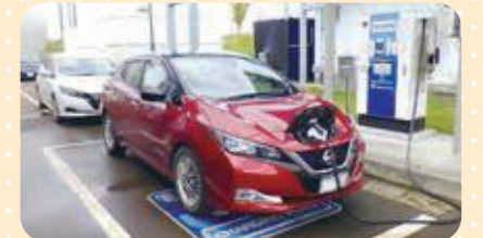
▲電気自動車用急速充電器 (無料・長岡市寿)

『生ごみから生まれた電気』は、温室効果ガスを出さない環境にやさしい再生可能エネルギーとして、電力会社に買い取られているのよ。その一部は施設の維持管理費や無料の電気自動車急速充電器などで市民のみなさんに還元しているのよ。