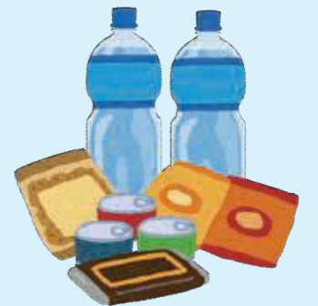
賞味期限と消費期限のイメージ

スナック菓子、カップ麺、チーズ、缶詰、ペットボトル飲料など、消費期限に比べ、傷みにくい食品に表示されています(作ってから3か月以上もつものは「年月」で表示することもあります)。賞味期限は、期限を過ぎても、すぐに食べられなくなるわけではありません。