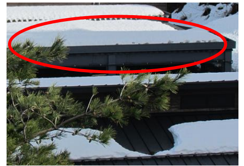
飼育ケージの上に積もった雪

飼育ケージを囲むネットに雪が積もったことにより光が遮られ、トキみ～て内も真っ暗に。