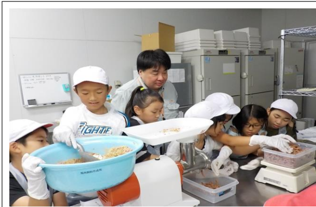
れいわがねん がっ にちおおかわづしょうがっこう ねんせい 令和元年6月28日大河津小学校4年生