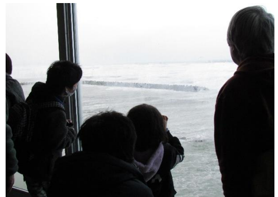
れいわ ねん がっ にち ふゆ うみどりかんさつかい 令和2年2月23日の「冬の海鳥観察会」

しんがた かんせんしょう はや しゅうそく 新型コロナウイルス感染症が早く収束し、トキみ～てに みな き きたの 皆さんが来てくださるのを楽しみにしています。