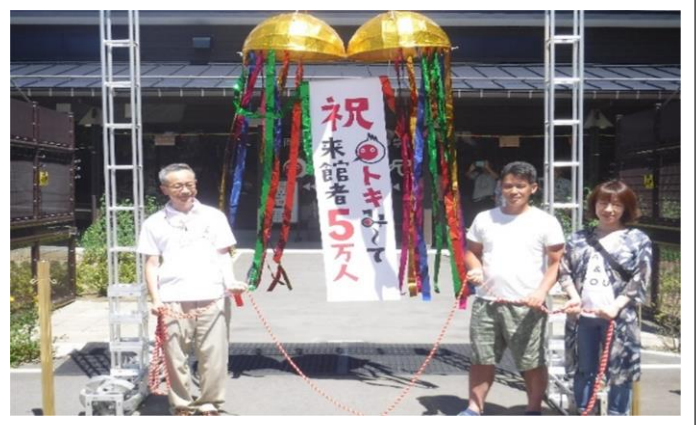
れいわがねん がっ か らいかんしゃ まんにんたっせい 令和元年7月7日、来館者5万人達成

れいわがねんど いく ちいき こうりゅう 令和元年度は、幾つものイベントがあり、地域との交流も さか おこな 盛んに行われました。