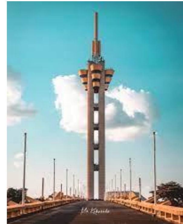
キンシャサの有名なタワー

ア：私のグループの言葉あります。センターのグループと上のグループは言葉違います。