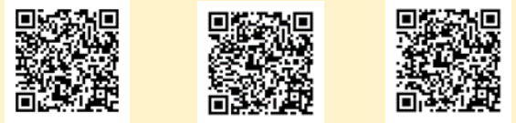
にほんご 簡体中文 English

国保と 国民年金が わからない人は、「長岡暮らしのしおり」（やさしい日本語・英語・中国語・ベトナム語）に 説明が あります。国保は 51ページ、国民年金は 54ページです。こちらの QRコードから ダウンロードできます。