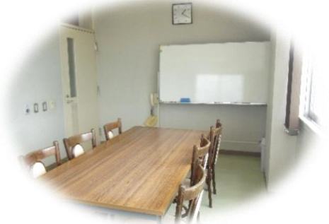
サンラックおぢや 相談コーナー