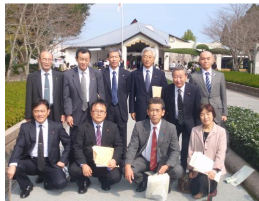
知覧特攻平和会館

2日目は南九州市の「知覧特攻平和会館」において、特攻隊員たちの遺書・手紙などの閲覧や平和学習講話を通じ、平和の大切さ・ありがたさ、命の尊さを学習できる施設を視察しました。当地には大東亜戦争時に遂行された特攻作戦の出撃基地が存在し、昭和49年に建設された特攻遺品館を前身として本平和会館に至っています。視察当日も大勢の中高生が見学を訪れており、