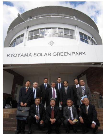
京山ソーラーグリーンパーク

岡山市では、京山ソーラーグリーンパークで「植物工場の運営」について視察しました。太陽光発電と植物工場を連携させたユニークな施設です。産業技術総合研究所が行っている集光型太陽光発電システムは、レンズを用いて太陽光を通常の500倍以上の光強度で集め、集光型太陽電池によって発電する効率のよい電源設備です。しかしその反面、コストが高い、強風に弱いなどの欠点もあり、まだ実験段階という感じでした。その電気を利用した両備ホールディングスの植物工場は、植物人工栽培研究施設として、農薬などを使わない安全・安心な野菜の大量生産技術の確立を目指し、特定疾患患者対象の低カリウム野菜、えぐみや青臭さを除去した野菜などの開発研究を行っています。現時点では高コストのため一般市場に出荷するまでには至っていないとのことですが、今後の研究が待たれます。