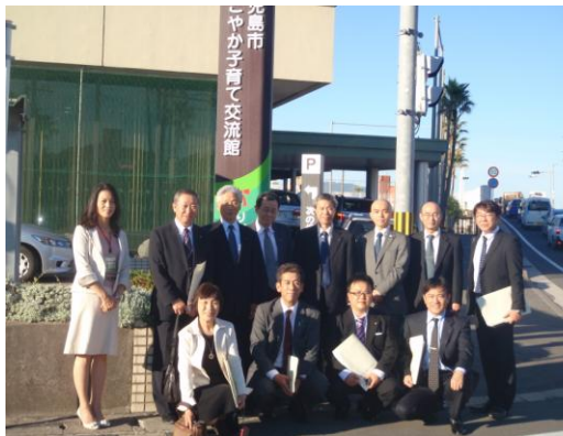
すこやか子育て交流館

火に伴う降灰により子供の外遊びに対する懸念があり、こういった屋内遊戯施設に対する一定の需要があるため、元来市職員の保養施設であったものを、平成22年度から子育て支援施設として改装し現在に至ります。鹿児島市では初の子育て支援施設であり、長岡市における「ぐんぐん」「てくてく」「ちびっこひろば」に類似する施設です。調理場、楽器コーナーなど、長岡市にはない施設が併設されていますが、使用状況の主たるものは遊戯広場でした。利用状況は年間約15万人と想定を上回る状況です。利用者数に比べ託児業務の利用者数は年間約2000人