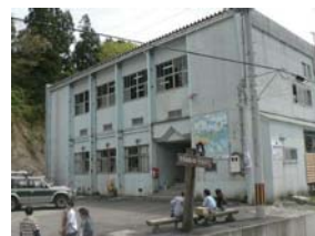
【法末自然の家やまびこ】

また、川口地域においても、廃校になった木沢小学校を再利用し、集落のおとうさんが多様な体験プログラムで、おかあさんたちが地元の米や野菜、山菜で作る郷土料理でもてなす交流拠点「朝霧の宿やまぼうし」を運営している。