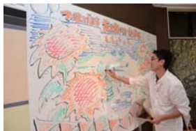
【オール川口フェスタ 即興イラストパネル展】

竹田集落は、震災後世帯数が10戸から7戸に減少、過疎化がさらに加速しているが、温泉やホテル、運動公園などに近接し、集落背後の尾根に東山遊歩道があり、自然散策や景観、眺望を楽しむ人が多く訪れている。