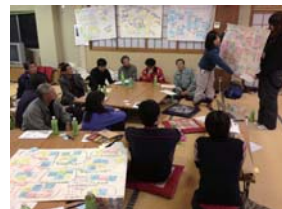
【栃尾地域でのインターンの活動】