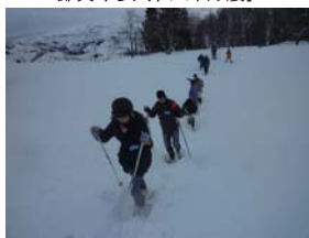
【かんじきウォーク】