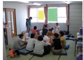
【にな二ーナの活動】