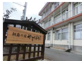
【朝霧の宿やまぼうし】