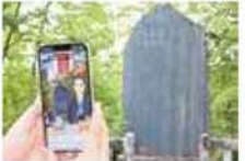
ARで学ぶ石碑めぐり

面積8,000㎡の広場。花見のシーズンになると、桜の木の下に腰を下ろし、多くの人が美しい桜に酔いしれる。桜まつり期間中は自由広場周辺にたくさんの屋台が並び、