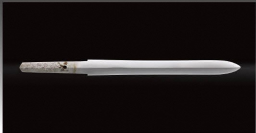
剣/天田昭次・収貞 合作 平成元年八月日