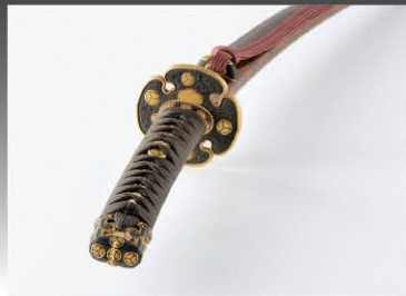
菱紋金具半太刀拵