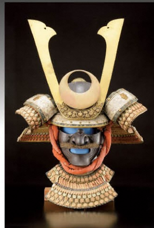
緋緘三十二間筋兜

「日本刀の美」は、日本美術刀剣保存協会(日刀保)長岡支部の協力のもと、平成20年から4年に1度開催し、このたび第5回目を迎えます。今回の主な作品として、鎌倉初期の「古一文字」、ゲームでも話題の「堀川国広」、大迫力の太刀身槍「同田貫上野介」、越後に関わりのある「桃川長吉」「栗原信秀」「和泉守兼定」「北越兼宗」「田村國守」「岩野道壽」、現代の「天田昭次・収貞」合作の剣などを展示します。また、市内和島地域の城之丘遺跡より出土した新潟県指定文化財の「毛抜形太刀」も併せて公開します。