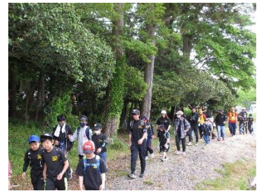
（昨年開催時の様子）