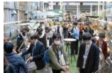
▲支援金を活用して開催された「まちなかぶんかさい」（昨年10月）