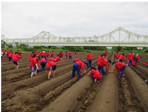
▲大島中学校生徒による種まき（R6.5.31）

※ 花・はな広場は、信濃川の河川敷を利用し、長岡市が整備した河川公園です。良好な景観とうるおいあふれる憩いの場にしようと、平成15年度から毎年、市民が菜の花の種まきを行っており、平成28年度からは、長岡花火来場者をおもてなしするため「ひまわり」に変更しました。