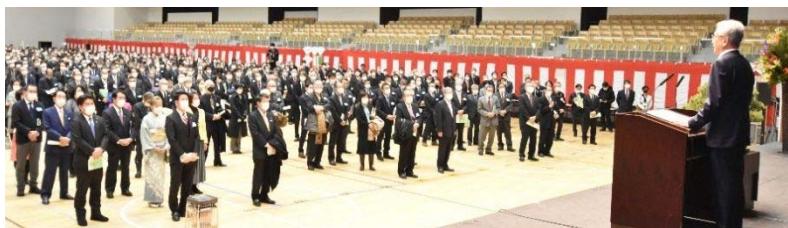
各界のトップが集まる市内最大の催し