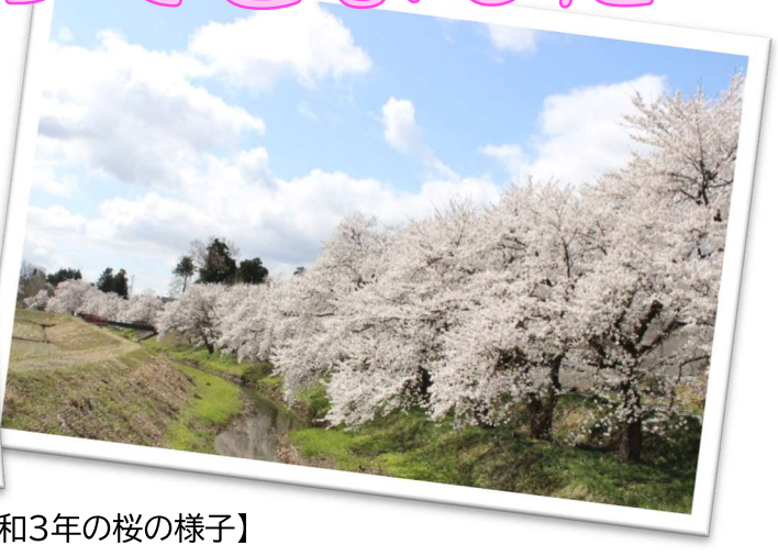
【令和3年の桜の様子】