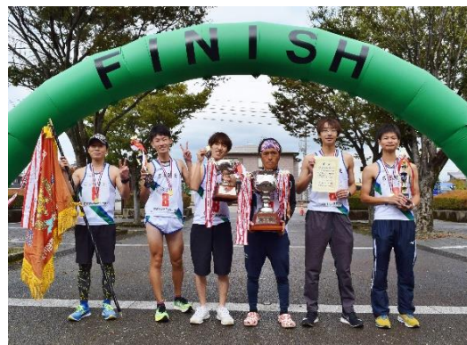
優勝した「岩塚製菓アスリートクラブ」