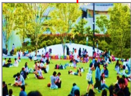
芝生広場(イメージ)