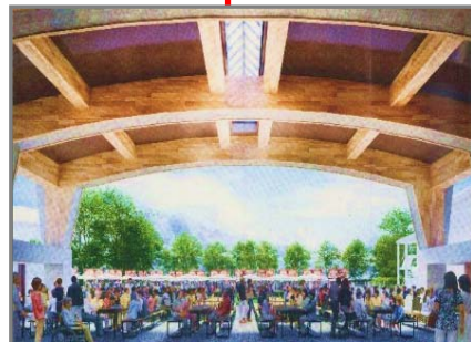
交流拠点施設からのビュー(イメージ)

お詫びと訂正 栃尾支所からのおしらせ (12月1日発行) 年末年始の休み (各施設の休館日) 栃尾美術館 12/27(月) 休館 栃尾地域図書館 12/27(月) 休館、12/28(火) 開館