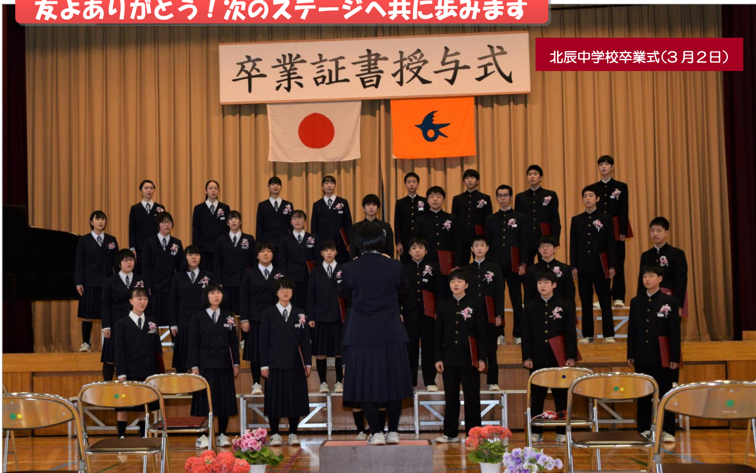
北辰中学校卒業式(3月2日)