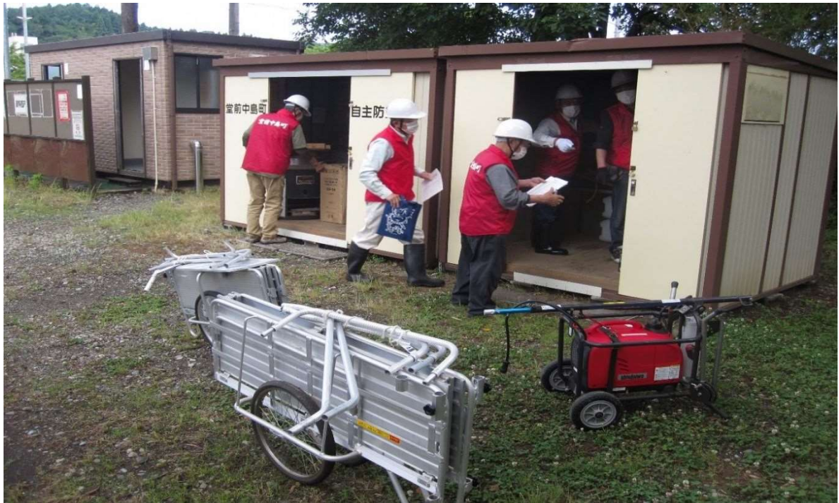
(堂前中島町自主防災会 避難訓練)