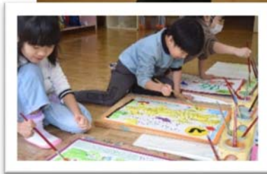
(与板幼稚園児がトラにちなんだカルタを作成)