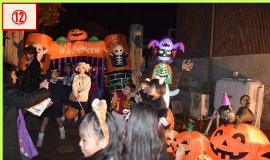
⑫ 色とりどりの衣装をした子供たち、商店街がにぎわったハロウィンの夜。