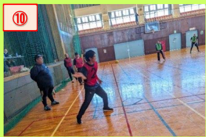
⑩ 与板地域で初めて開催されたニュースポーツ「ベースボールファイブ」です。皆さん、初めての競技でしたが、楽しくプレーしていました。