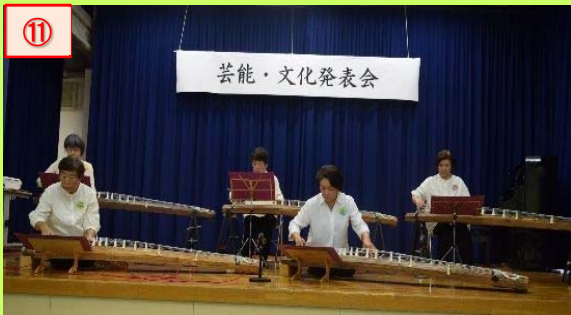
⑪ よいた文化協会が開催した「芸能・文化発表会」では、皆さん、日ごろの練習の成果を存分に発揮されていました。また、「作品展」も同時開催されました。