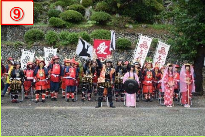
⑨ 中学生が大活躍した天地人行列。楽山苑前を出発し、天地人通り、アーケードを練り歩きました。勝どきの「エイ、エイ、オー！」が響き渡りました。