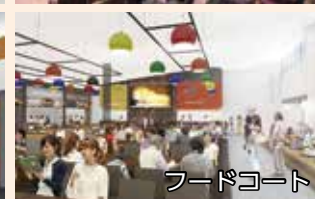
※イラストはイメージ図です