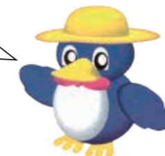
▲長岡の環境キャラクター・ペギーちゃん

ごみは、収集日を確認して、必ず午前8時30分までに 出しましょう。 ごみの分別に一層のご理解とご協力をお願いします。