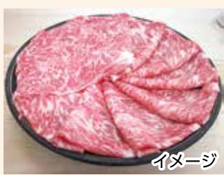
①山古志産にいがた和牛 …5人