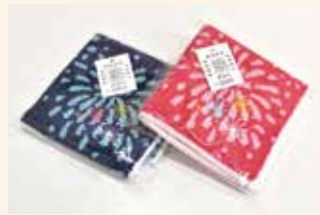
⑤長岡花火ハンカチ …6人(色は選べません)