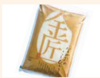
②ながおかこしひかり「金匠」(2kg)…10人