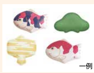
③小国和紙ミニケース …10人(形・柄は選べません)