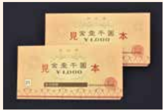
④長岡市共通商品券(2,000円) …15人