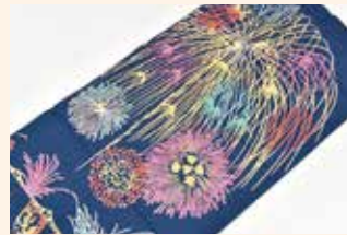
⑥長岡花火手ぬぐい …17人