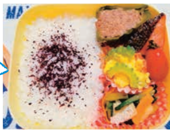
▲昨年度の「ぴったり賞」受賞作品

2 カフェDE健康講座 ① 8月11日(火)：骨粗しょう症と薬 ② 21日(金)：まちなかナイトウォーク ③ 27日(木)：カラダのために、おいしく減塩 ④ 9月2日(水)：体力バランスをチェックしよう 時①