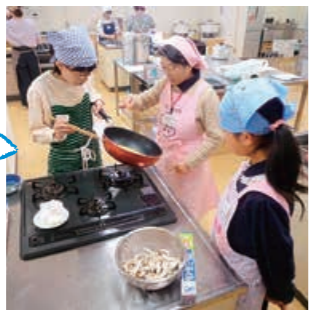
▲昨年の親子料理教室

地域の健康づくりや食育を広めるボランティアの食推進さん。現在、市内で559人が活動しています。